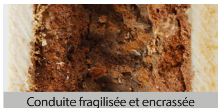
Conduite fragilisée et encrassée

ment impossible. Le revêtement protè-ge également contre la fragilisation, et le remplacement de composants perti-nents du système assure un fonctionne-ment impeccable pendant des années.